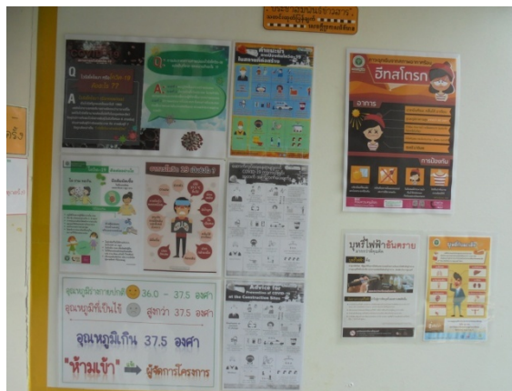
ภาพที่ 5-17 จัดทำป้ายประชาสัมพันธ์เรื่องโรคติดต่อให้คนงานได้ระมัดระวังเป็นพิเศษ