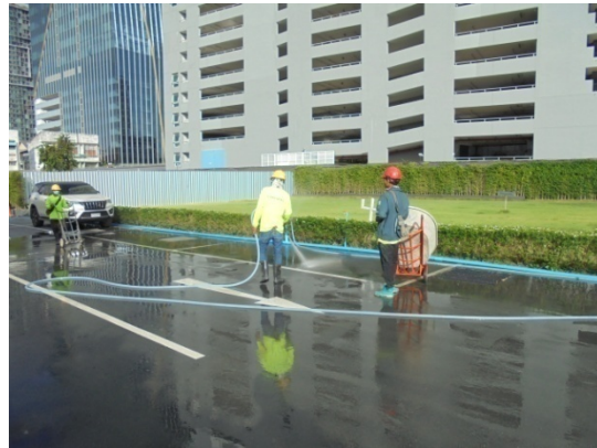
5-9 ฉีดล้างทำความสะอาดพื้นบริเวณทางเข้า-ออกโครงการ