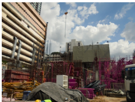
ภาพที่ 5-24 ติดตั้งนั่งร้านให้มีความปลอดภัย