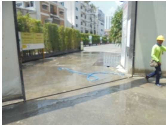
5-6 พื้นที่ลื่นลื่น