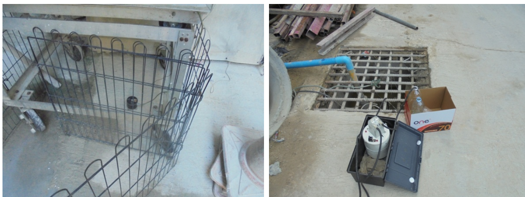
จุดตรวจวัดคุณภาพอากาศ เสียง และแรงสั่นสะเทือน จุดตรวจวัดก๊าซมลพิษ CO SO 2 NO 2 และ HC และเก็บตัวอย่างน้ำทิ้ง