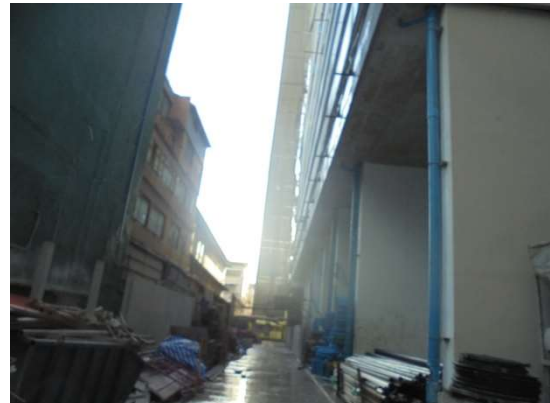
ภาพที่ 5-28 ตักเศษวัสดุก่อสร้างขนออกไปสู่ภายนอกโครงการและติดตั้งสเปรย์น้ำม่านน้ำบริเวณด้านหลังที่ติดกับอาคารข้างเคียง