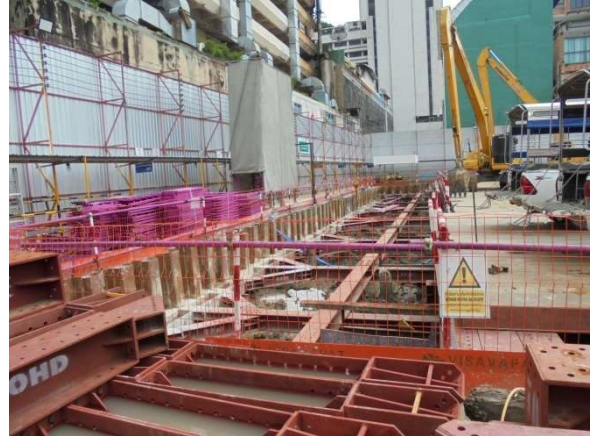
ภาพที่ 5-19 กดSheet Pile ระบบป้องกันดินพัง และติดตั้ง Inclinator ตรวจสอบการเคลื่อนตัวของดิน