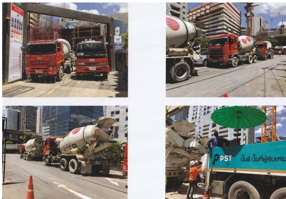
ภาพที่ 5-23 จอดรถปูนซีเมนต์ผสมเสร็จไว้ภายในพื้นที่โครงการเท่านั้น