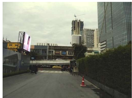
ภาพที่ 5-29 สวมใส่อุปกรณ์ป้องกันภัยส่วนบุคคล และทางเข้าออกโครงการมี รม.ดูแลการจราจร