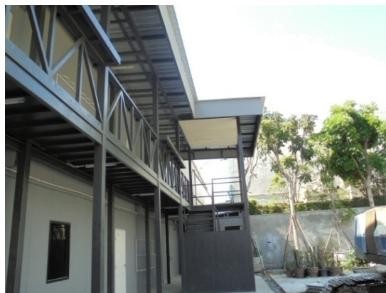
5-14 สำนักงานสนาม รับเรื่องร้องเรียน