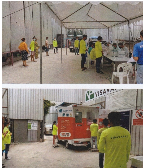
ภาพที่ 5-25 ตรวจสอบสุขภาพคนงาน

รายงานผลการปฏิบัติตามมาตรการป้องกันแก้ไขผลกระทบสิ่งแวดล้อมและมาตรการติดตามตรวจสอบคุณภาพสิ่งแวดล้อม โครงการ อาคารชุดดี แอดเดรส สยาม-ราชเทวี (The Address Siam-Ratchathewi) ตั้งอยู่ที่ ถนนเพชรบุรี เขตราชเทวี กรุงเทพมหานคร