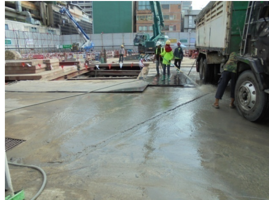
5-8 ฉีดล้างล้อรถบรรทุกก่อนออกจากโครงการด้วยสายฉีดน้ำแรงดันสูง