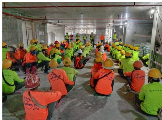
5-10 กิจกรรมอบรมเรื่องความปลอดภัยก่อนเริ่มปฏิบัติงาน Morning Talk