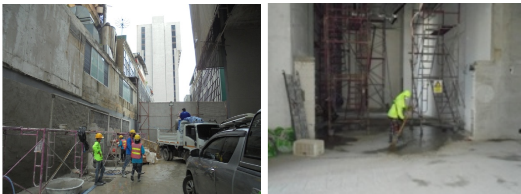
5-15 ล้างทำความสะอาดพื้นที่หน้างาน