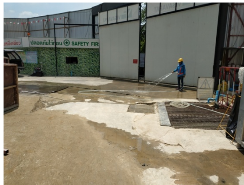
5-1 รั้วชั่วคราวสูง 6 เมตร ชิดโพนหนาประมาณ 5 ซม.ปัจจุบันทำรั้วคอนกรีตถาวรแล้ว