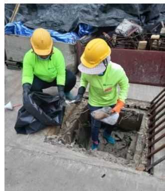
5-12 ล้างทำความสะอาดบ่อพักตะกอนและท่อระบายน้ำ