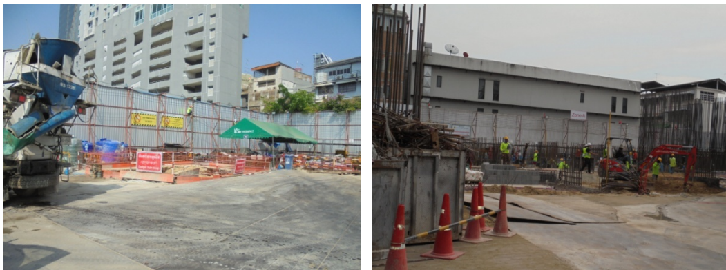
5-4 ปูแผ่นเหล็กหนาบริเวณพื้นที่โครงการ และรื้อกันตงช่วงการขุดดิน