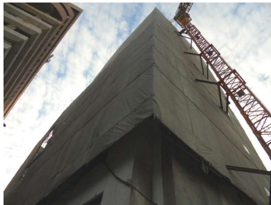
ภาพที่ 5-20 ปิดคลุมอาคารตามชั้นความสูงที่ก่อสร้างไว้ และใช้ทาวเวอร์เครน