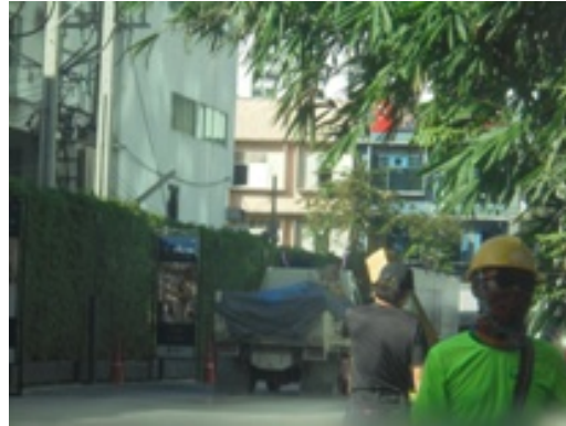
ภาพที่ 5-30 ปิดคลุมท้ายกระบะก่อนออกจากโครงการ