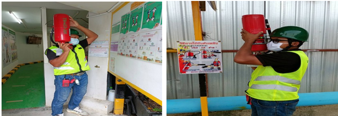
ภาพที่ 5-32 ตรวจสอบและอบรมการใช้อุปกรณ์ดับเพลิงและเตือนอัคคีภัยภายในโครงการ