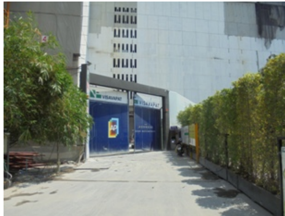
ภาพที่ 5-16 ประตูเข้า-ออกพื้นที่โครงการจะปิดไว้เสมอ

รายงานผลการปฏิบัติตามมาตรการป้องกันแก้ไขผลกระทบสิ่งแวดล้อมและมาตรการติดตามตรวจสอบคุณภาพสิ่งแวดล้อม โครงการ อาคารชุดดี แอดเดรส สยาม-ราชเทวี (The Address Siam-Ratchathewi) ตั้งอยู่ที่ ถนนเพชรบุรี เขตราชเทวี กรุงเทพมหานคร