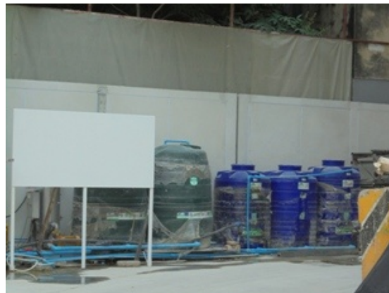
5-7 ถังสำรองน้ำใช้ภายในพื้นที่โครงการ