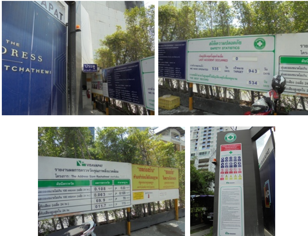
5-3 ป้ายแสดงรายละเอียดโครงการด้านหน้าประตูทางเข้า-ออกโครงการ และป้ายสถิติความปลอดภัย ป้ายแสดงผลตรวจคุณภาพสิ่งแวดล้อมและป้ายเขตก่อสร้าง ห้ามเข้าก่อนได้รับอนุญาต

รายงานผลการปฏิบัติตามมาตรการป้องกันแก้ไขผลกระทบสิ่งแวดล้อมและมาตรการติดตามตรวจสอบคุณภาพสิ่งแวดล้อม โครงการ อาคารชุดดี แอดเดรส สยาม-ราชเทวี (The Address Siam-Ratchathewi) ตั้งอยู่ที่ ถนนเพชรบุรี เขตราชเทวี กรุงเทพมหานคร