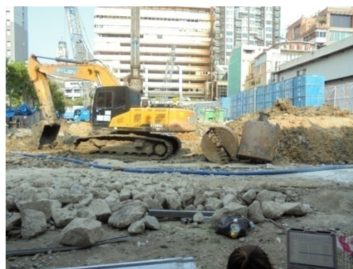
5-2 การทำเสาเข็มแบบเสาเข็มเจาะ