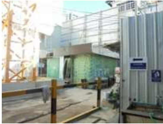
ภาพที่ 5-27 มีห้องน้ำคนงานก่อสร้างภายในพื้นที่โครงการ