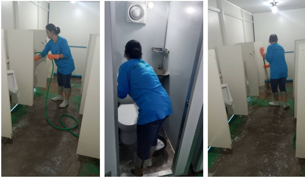
5-13 ล้างทำความสะอาดห้องน้ำเป็นประจำทุกวัน