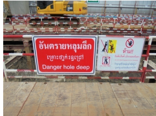
5-5 ป้ายเตือนมีรถบรรทุกวิ่งเข้า-ออก และป้ายบอกอันตรายช่วงการขุดดินและการปฏิบัติงานให้เกิดความปลอดภัย