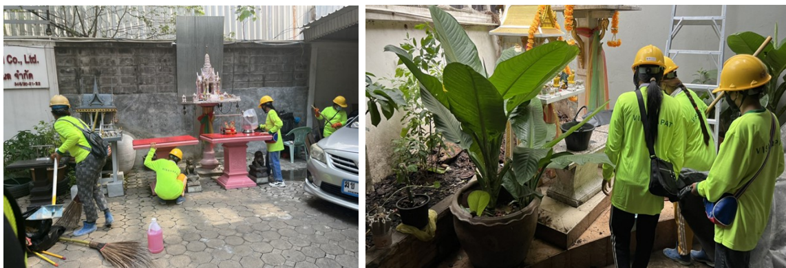
ภาพที่ 5-26 เข้าพบปะพูดคุย และ ซ่อมแซมบ้านข้างเคียง