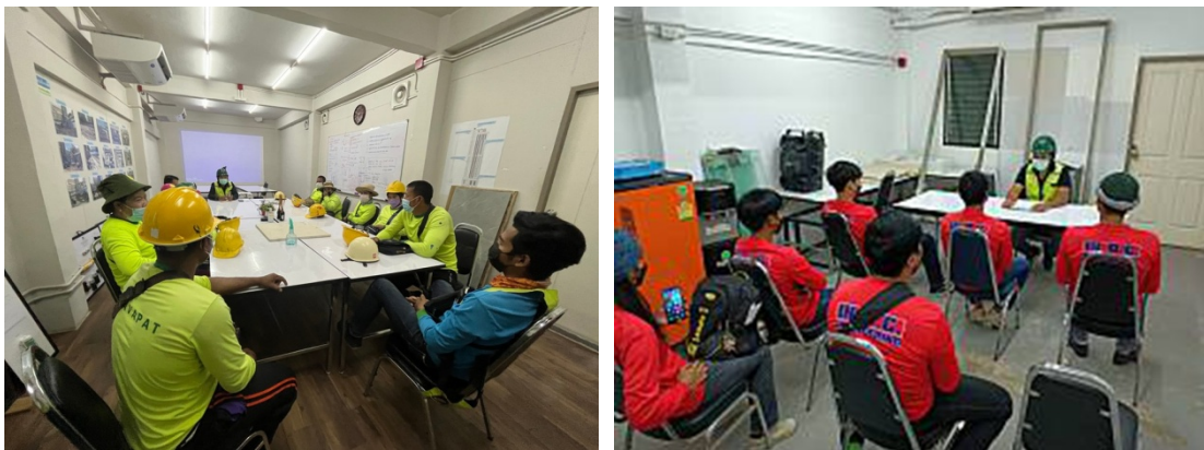
ภาพที่ 5-33 ประชุมแผนงานประจำสัปดาห์และอบรมพนักงานฝ่ายก่อสร้างให้ปฏิบัติตามมาตรการและมีความปลอดภัย