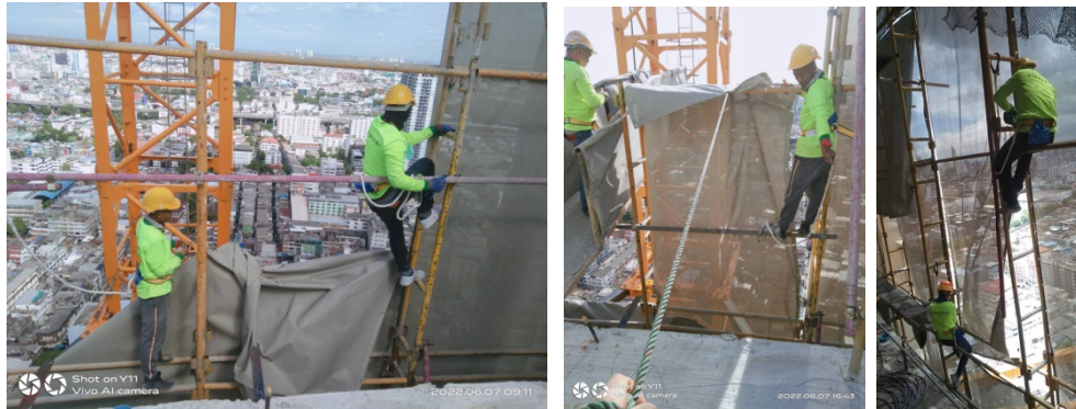
ภาพที่ 5-22 สวมใส่อุปกรณ์ป้องกันภัย เช่น เข็มขัดนิรภัยในการขึ้นที่สูง