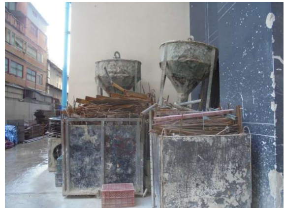
ภาพที่ 5-21 จัดพื้นที่สูบน้ำหรือไว้เฉพาะ และคัดแยกวัสดุไว้อย่างเป็นสัดส่วน