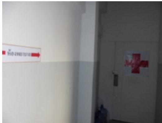
ภาพที่ 5-31 ห้องพยาบาลประจำโครงการ